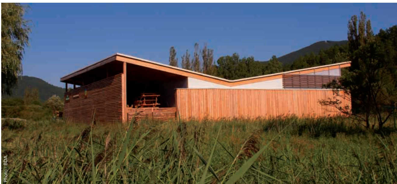
▲ Atelier de l'Office national des forêts à Barrême (04). Le bâtiment a mobilisé près de 140 m 3 de bois certifié Bois des Alpes, utilisant des essences alpines du sud comme le mélèze, le sapin, le pin noir ou le pin sylvestre des communes environnantes.

Créée en 2008, l'association Bois des Alpes s'est donné pour objectif de promouvoir les bois issus des massifs forestiers alpins. Une mission, soutenue depuis 2012 par France Bois Forêt, qui connaît aujourd'hui une véritable montée en puissance.