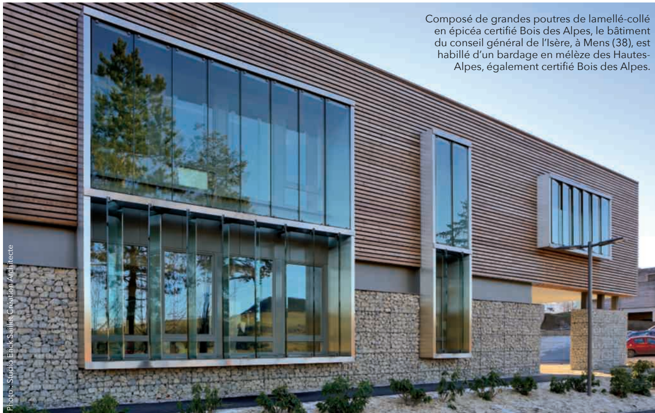
Composé de grandes poutres de lamellé-collé en épicéa certifié Bois des Alpes, le bâtiment du conseil général de l'Isère, à Mens (38), est habillé d'un bardage en mélèze des Hautes-Alpes, également certifié Bois des Alpes.

Photo : Studio Erick Sallier, Création Architecte